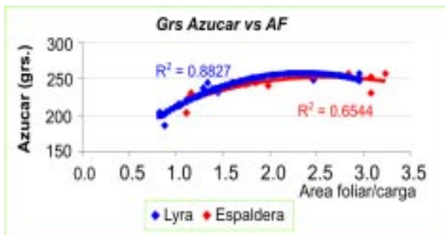
Gráfica 1 - Efectos de la relación área foliar/carga en el contenido de azúcares de la uva.