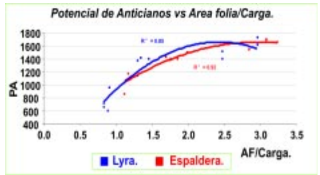
Gráfica 2 - Efecto de la relación área foliar/carga en el color (contenido de antocianos) de la uva